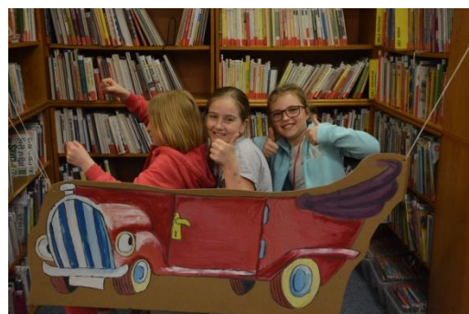
Noc s Andersenem 2017